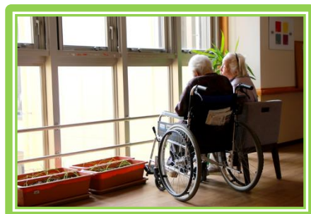
No.57 午後から会議 世界はここから始まるのです。 小さなことからコツコツと～