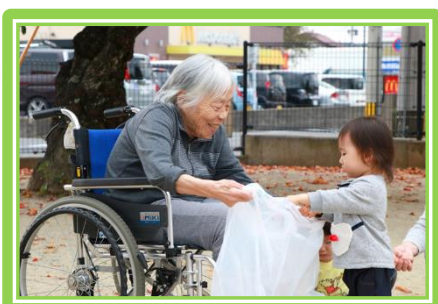
No.62 公園清掃 施設敷地内にある保育園の園児と清掃 活動のコラボ